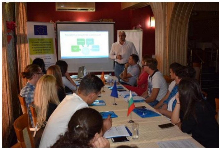
Укрепване на туристическото предприемачество и насърчаване на услугите в туризма / Издание: община Кюстендил - Близостран

7 януари 2018 09:10 Автор: Платена публикация