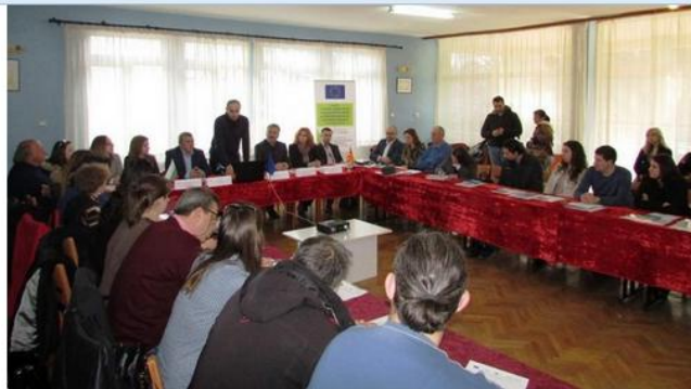
Подготовка на бизнес план - Кюстендил